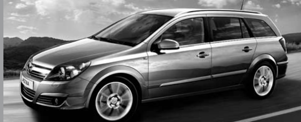
Abbildung zeigt Sonderausstattung. Astra Caravan 1.4 (90 PS), Gesamtverbrauch (99/100/EG), 6.3 l/100 km, CO 2 -Emission 151 g/km (nat., 0200 g/km), Energieeffizienz B.